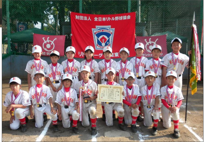
<準優勝 千葉市リーグ>